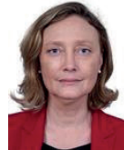
2º Secretária Maria do Rosário (PT-RS)