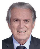
1º Secretário Luciano Bivar (UNIÃO-PE)