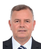
4º Secretário Lucio Mosquini (MDB-RO)