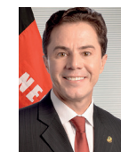
1º Vice-Presidente Veneziano Vital do Rego (MDB-PB)