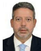
Presidente Arthur Lira (PP-AL)