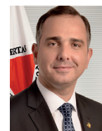
Presidente Rodrigo Pacheco