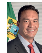
4º Secretário Styvenson Valetim (Podemos-RN)