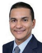
1º Vice-Presidente Marcos Pereira (Republicanos-SP)