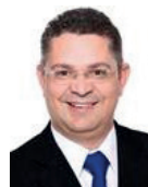
2º Vice-Presidente Sóstenes Cavalcante (PL-RJ)