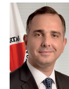
Presidente Rodrigo Pacheco (PSD-MG)