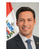
2º Vice-Presidente Rodrigo Cunha (União-AL)