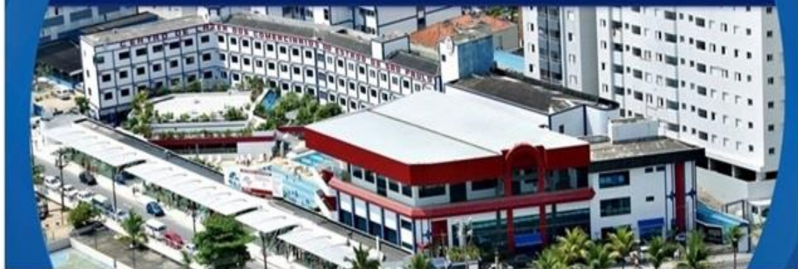
TABELA DE PREÇOS DE DIÁRIAS EM VIGOR A PARTIR DE 3 DE JANEIRO DE 2024